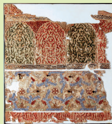
Panel de estuco policromado. Mirador occidental del Patio de la Acequia del Generalife, ca. 1273-1309. Museo de la Alhambra.