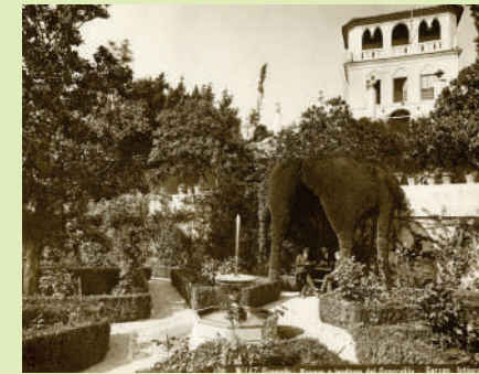
"Paseos y jardines del Generalife" [Glorieta en los Jardines Altos del Generalife]. Ca. 1890.