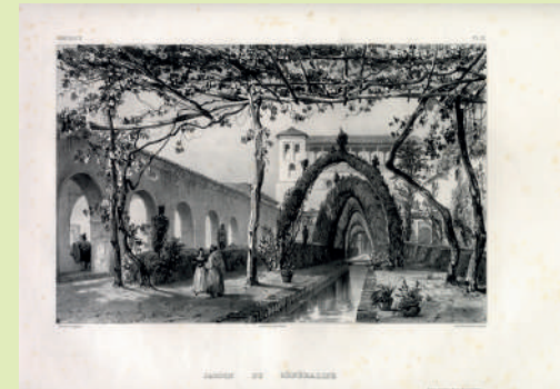
"Jardin du Généralife" [Patio de la Acequia]. 1833.

Fue mimado por los sultanes nazaríes que lo crearon, por los alcaides de la familia Granada-Venegas que estuvieron a su cuidado durante cuatro siglos y luego por los gestores del Patronato de la Alhambra y Generalife.