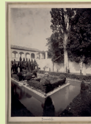
"Generalife" [Jardín del Patio de la Sultana]. 1880-1890.