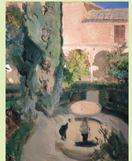
Joaquín Sorolla, [Jardín de Lindaraja], 1909. Óleo sobre lienzo. Museo de la Alhambra.