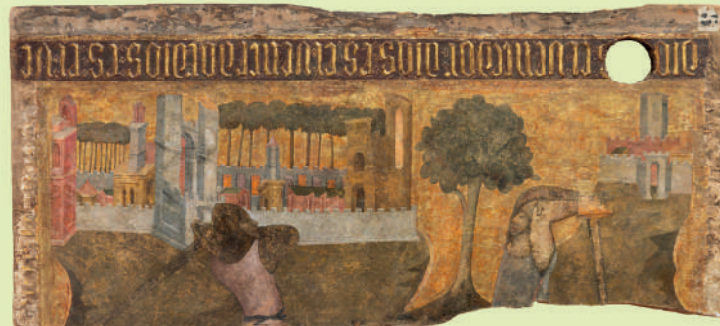
Pintura sobre tabla representando la lucha de dos guerreros. Alhambra, Palacio de los Leones, sala de los Mocárabes, ca. 1380. Museo de la Alhambra.

Para los amantes de los jardines la Alhambra y el Generalife son sublime referente de belleza y de maestría en el manejo del agua.