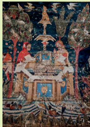
Pinturas de la Sala de los Reyes. Palacio de los Leones, Alhambra. Detalle de la bóveda norte.