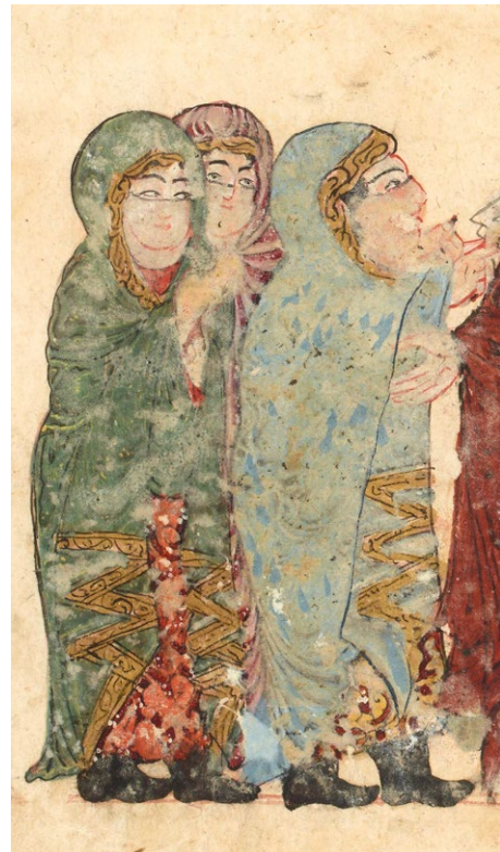
Figs. 2 y 3. Detalles de Les Makamat de Hariri (1236-1237). Bibliothèque Nationale de France (BnF). Département des Manuscrits. Arabe 5847

Aunque la investigación sobre la indumentaria andalusí se centró fundamentalmente en el estudio del atuendo masculino y de las clases poderosas –sobre todo de personajes notables y militares–, desde hace décadas se está trabajando con detalle y rigor en el estudio de la vestimenta femenina desde diversas ópticas: como parte de la obligación masculina de manutención tras el matrimonio; qué tipo de indumentaria usaban las mujeres para salir a la calle; cuál fue el vestuario según clase social, género, religión, edad, estación del año o festividades, etc.