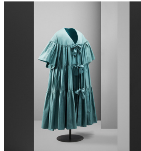
MANUEL PERTEGAZ, 1954 Abrigo de cóctel en tafetán de seda verde. Centre de Documentació i Museu Tèxtil de Terrassa

EXPOSICIÓN TEMPORAL HENRY CLARKE Y LA MODA DE ESPAÑA BAJO EL INFLUJO DE LA ALHAMBRA Del 2 de marzo al 4 de junio de 2023 Conjunto Monumental de la Alhambra y Generalife. Palacio de Carlos V. Capilla Entrada gratuita