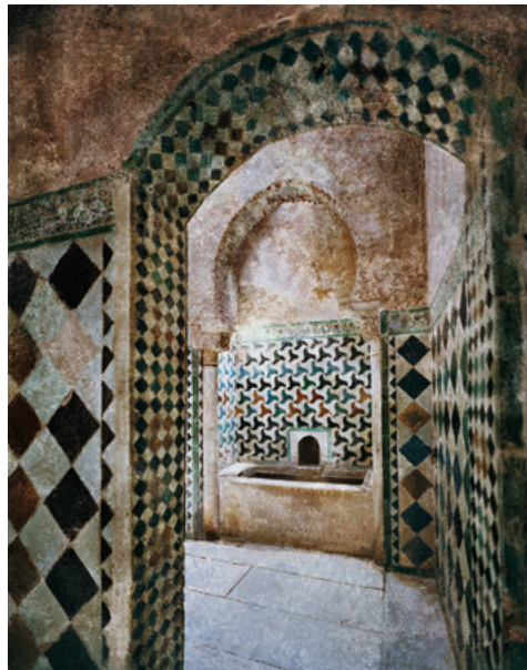
FERNANDO MANSO, 2012 Interior del baño del Palacio de Comares. Serie Alhambra oxidada.

los mejores escaparates de Nueva York y acaparan las portadas de las principales revistas internacionales de moda.