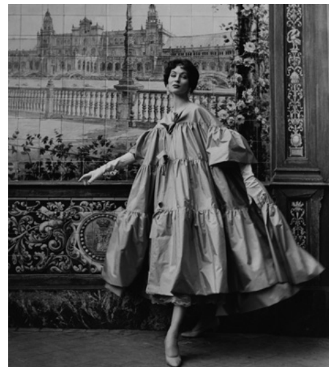
HENRY CLARKE, 1954 La modelo y actriz estadounidense Suzy Parker con un abrigo de cóctel en tafetán de seda ondulado con lazo de Manuel Pertegaz. Sesión realizada en el restaurante Villa Rosa de Madrid. Archivo VOGUE

«Emocionantes las colecciones españolas de este año, con espléndidos cortes, abrigos de pura sastrería, formas vivaces y buen punto. Looks de noche en negro y con purpurinas. Todo fotografiado en la Alhambra, en Granada...».