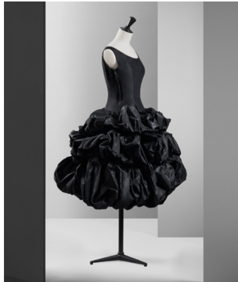
MANUEL PERTEGAZ, ca. 1950 Cocktail dress in silk taffeta and cotton tulle. Carlos Milla Collection

Taking that transcendental connection within Spain’s legacy as our starting point, this exhibition seeks not only to commemorate that reportage, which travelled around the world, but also to analyse and reflect upon those who made it possible. The show is articulated around a selection of pieces of various natures and provenances, from Henry Clarke’s actual photographs to the items of clothing that appear or might have appeared in them, as well as artworks, photographs, books, magazines and pieces of furnishing or decorative features from the Alhambra itself.