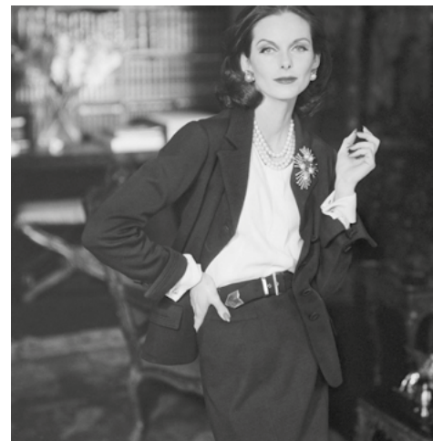
HENRY CLARKE, 1955 Two-piece suit in navy blue wool by Chanel for VOGUE PARIS. Model: Anne Sainte-Marie. Palais Galliera - Musée de la Mode de la Ville de Paris

The Alhambra of Granada has always fascinated its visitors with its beauty, harmony, colour, light and spirituality. The palace-city has inspired prose and poetry by such famous authors as Washington Irving (in his Tales of the Alhambra) and more contemporary writers like the British author Salman Rushdie or one of the most illustrious lovers of Granada, Antonio Gala. Its halls have captivated draughtsmen, painters and photographers who were drawn by its sensual architecture, its rich decoration and, especially, its light. The Alhambra is made into both setting and protagonist through the eyes of Joaquín Sorolla, Mariano Fortuny, López Mezquita, M. C. Escher, Alberto Schommer, Manuel Rivera, Roland Fischer, Fernando Manso and, of course, Henry Clarke.