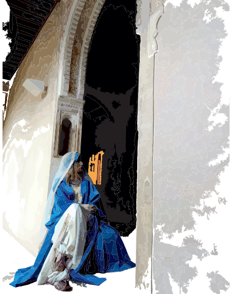
PALACIO DE DAR AL-HORRA

Días: 8 de septiembre, 6 de octubre, 3 de noviembre y 1 de diciembre