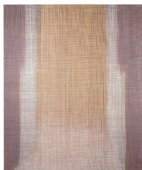
Soledad Sevilla, Sabrás de mi ser si mi hermosura miras , 1984 Colección Artística del Patronato de la Alhambra y Generalife

La siguiente serie pictórica, titulada La Alhambra (1984-1985) constituye un trabajo de reinterpretación del palacio nazarí. En este caso hay un uso del color más medido, aunque la retícula es también una base de referencia. Como cierre de este proyecto realiza en 1987 la instalación Fons et origo , que propone recrear el ambiente nocturno de los reflejos sobre el estanque de uno de los patios de la Alhambra.