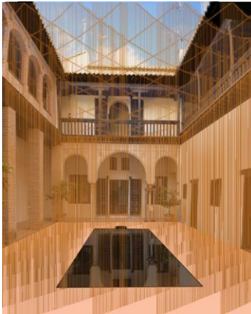
Simulación de la instalación en la Casa Horno de Oro

recita la poesía es ella (esta pieza cobra el nombre del lugar donde se instala) hace descender lentamente gotas de agua por los hilos de cobre.