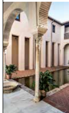
Casa de Zafra