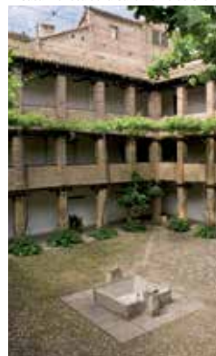
Corral del Carbón