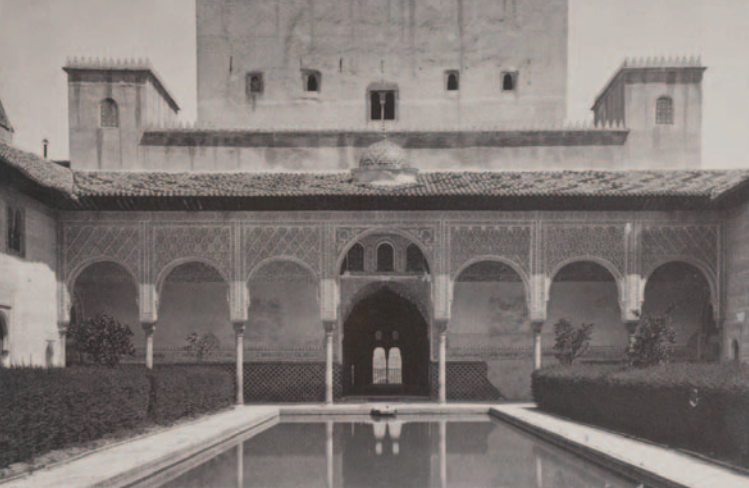
Exterior de la galería lateral izquierda del Patio de los Arrayanes (1871)