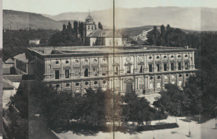
Vista general panorámica de la Alhambra desde la torre del Homenaje [1872] (detalle)