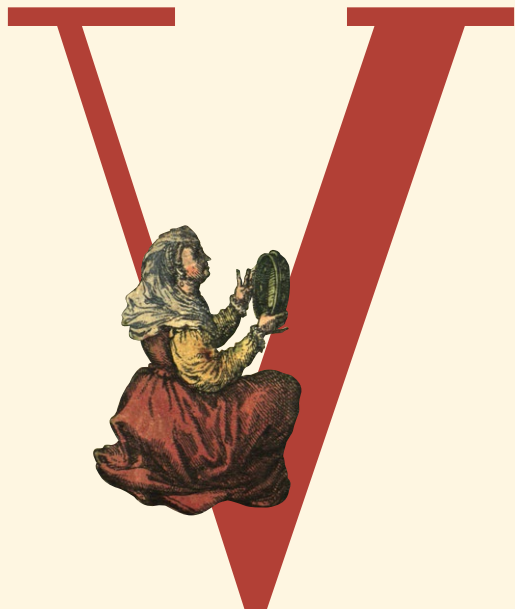
IMAGEN DE PORTADA Braun, Georg. Civitates Orbis Terrarum (1577-1590)