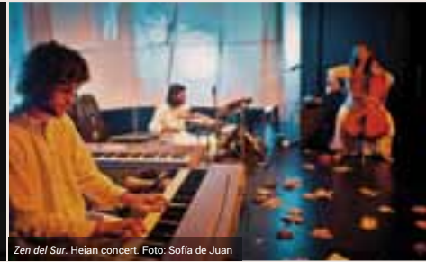
Zen del Sur. Heian concert.