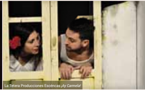
La Tetera Producciones Escénicas ¡Ay Carmela!