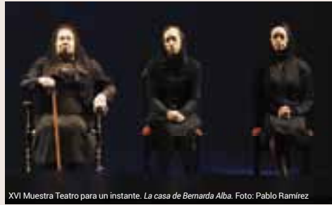
XVII Muestra Teatro para un instante. La casa de Bernarda Alba.