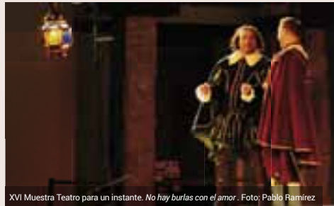
XVI Muestra Teatro para un instante. No hay burlas con el amor.