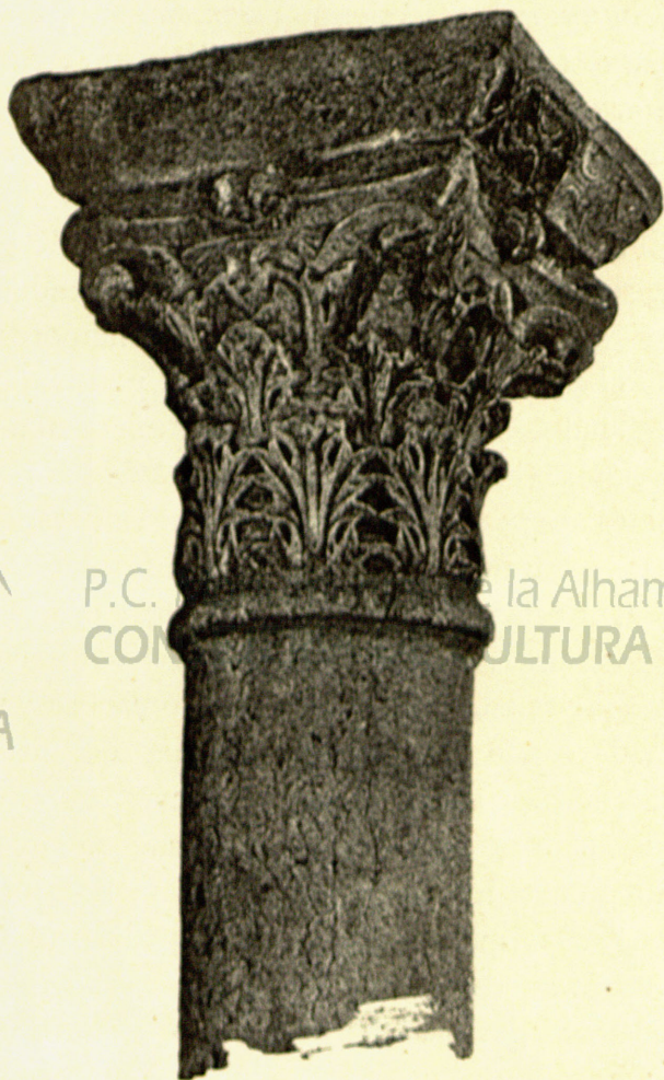
CAPITEL DE LA CATEDRAL.

sumo algún adorno sencillo esculpido en su dintel, realzado tal vez con vivos colores.—Aquella ventana donde se asomaba, según nos refiere el mismo santo, la venerable abadesa Isabel