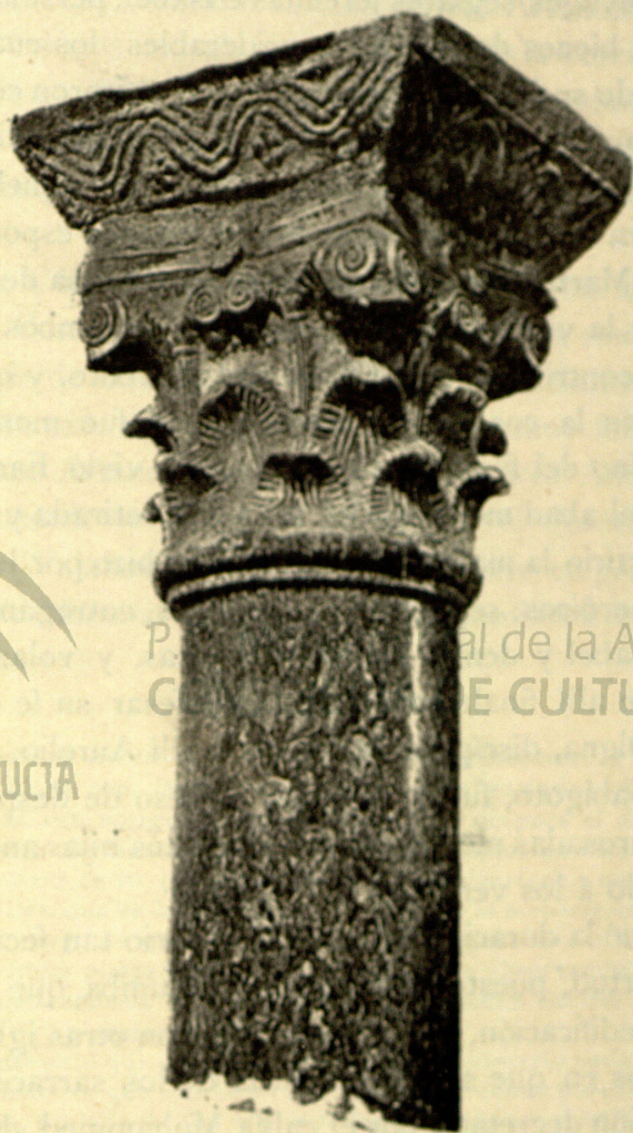
CAPITEL DE LA CATEDRAL

Más internado en la Sierra, pero en la misma dirección norte