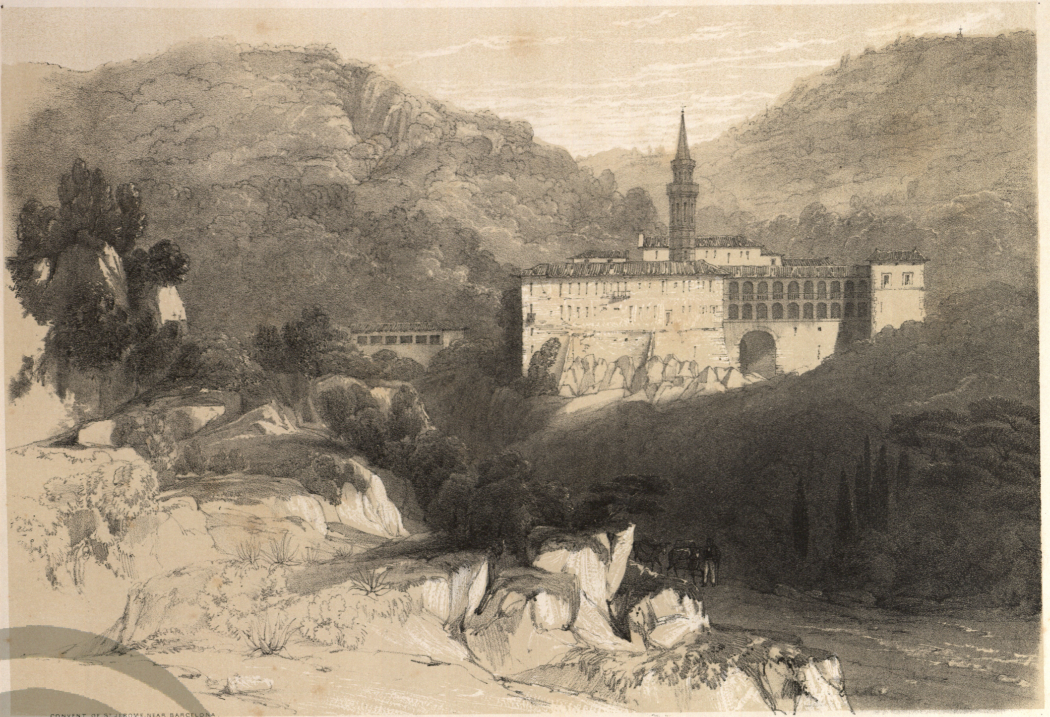
CONVENT OF ST. JEROME NEAR BARCELONA P. Heman Esq. del.