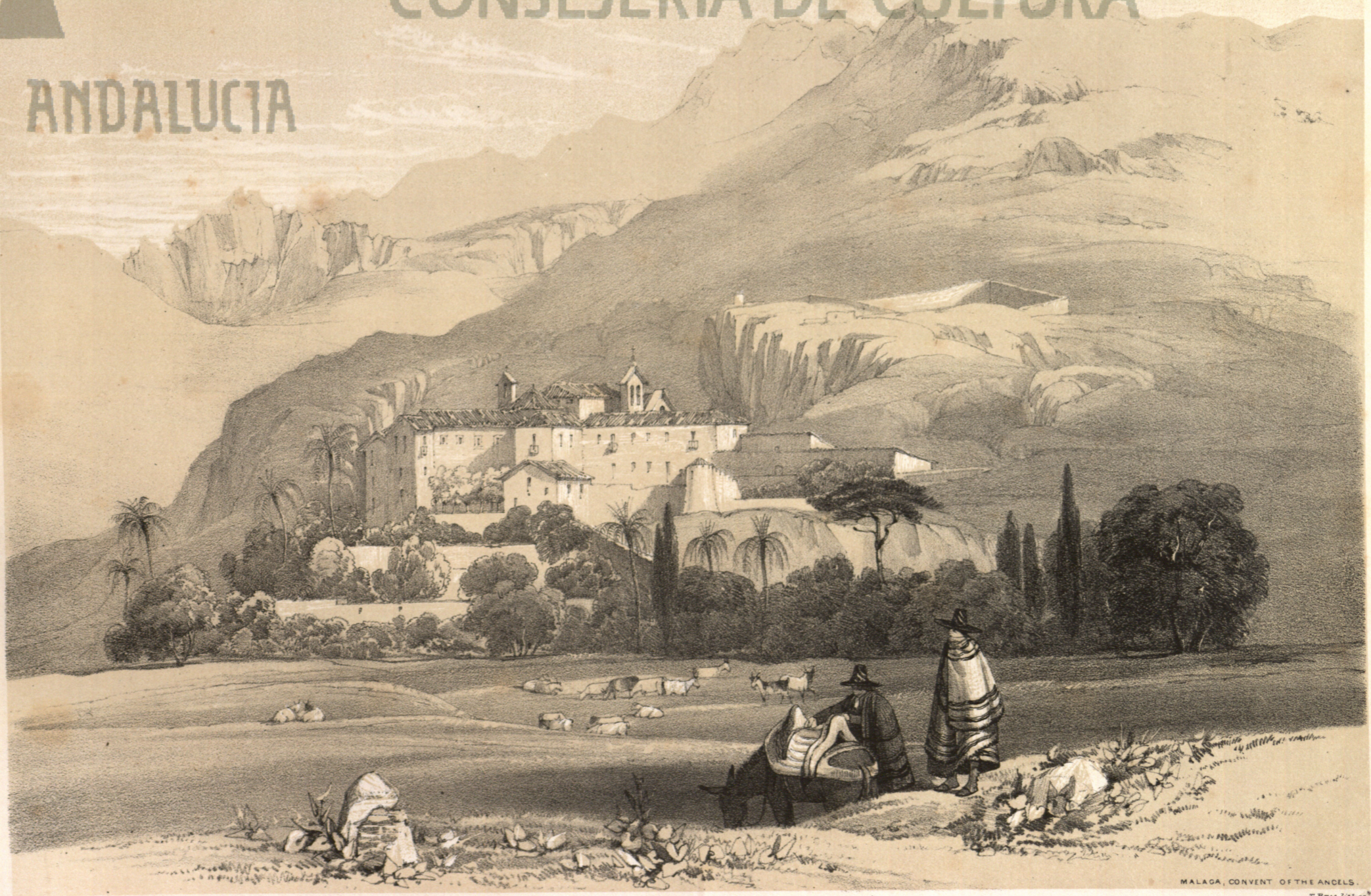
P. Heman Esq. del.