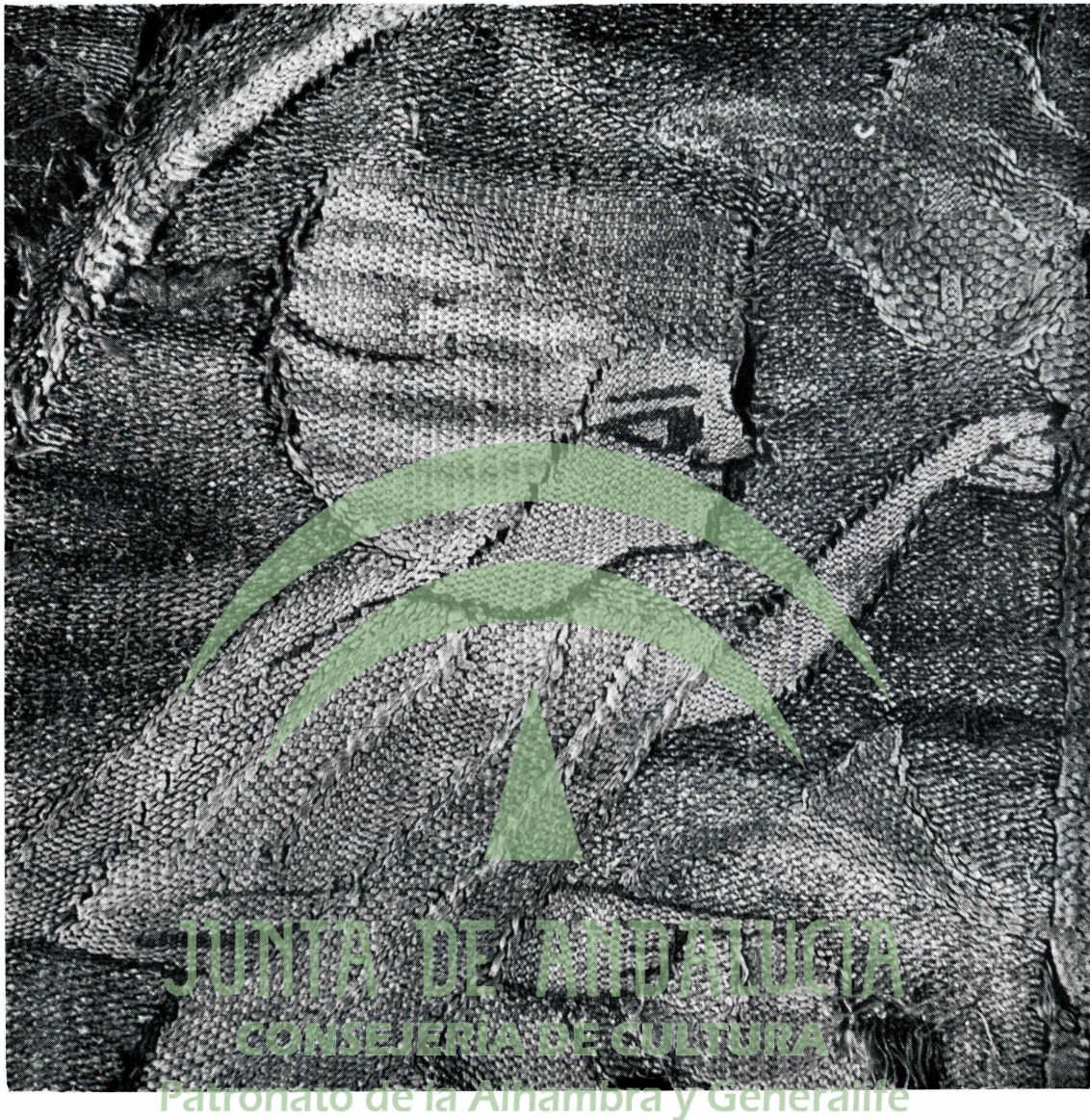
a) Detalle del fragmento de tejido de la lámina XX.