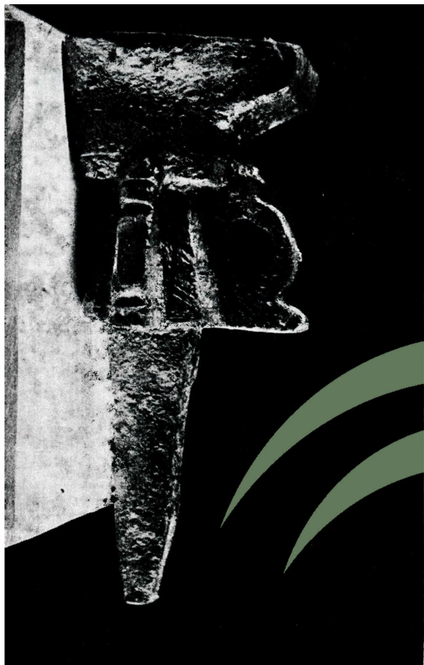
a) Yunque de hierro, posiblemente musulmán. Museo de la Alhambra.

JUNTA DE ANDALUCÍA CONSEJERÍA DE CULTURA Patronato de la Alhambra y Generalife