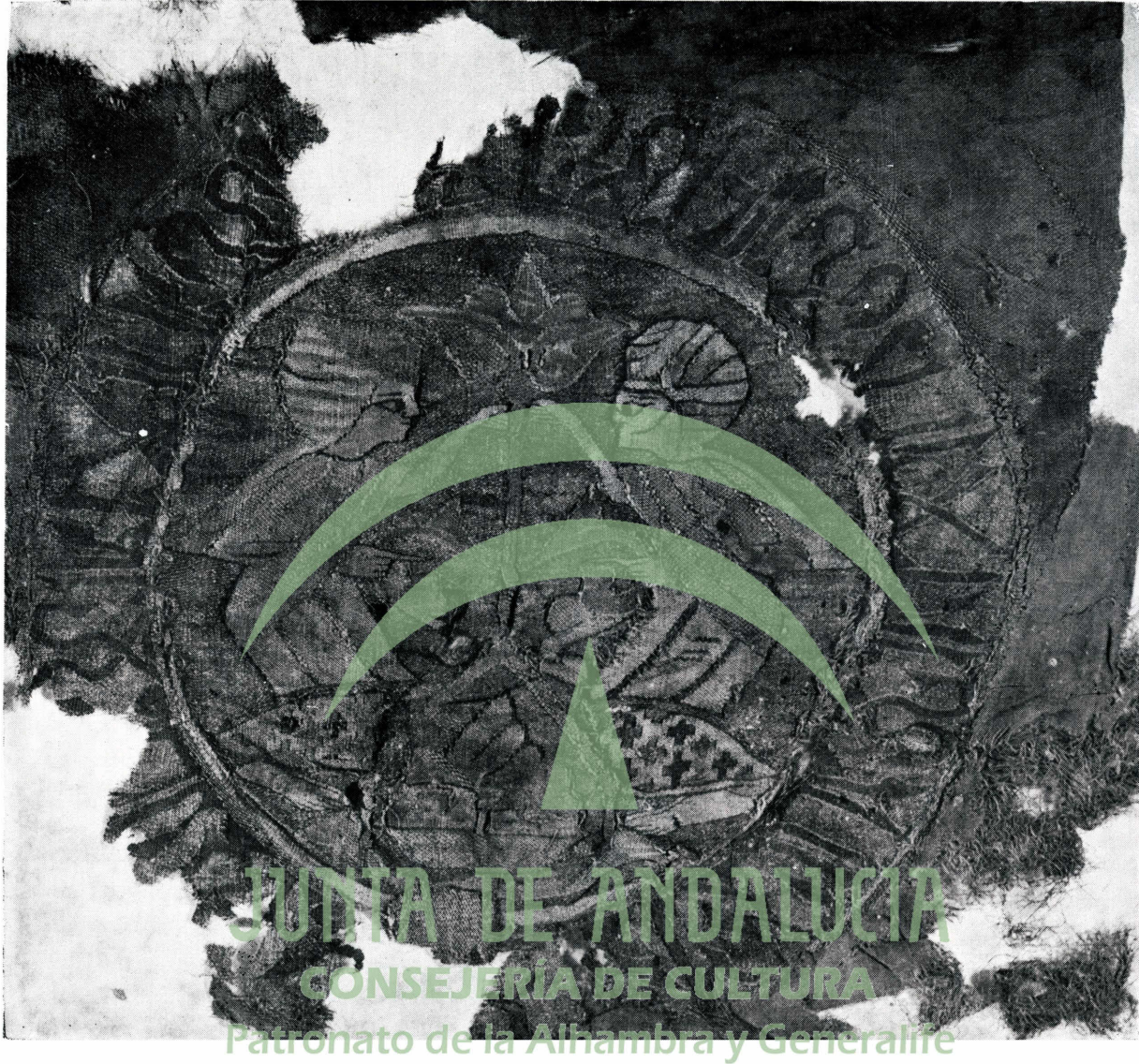
Fragmento de tejido oriental procedente del sepulcro del obispo Arnaldo de Gurb. Siglo XIII