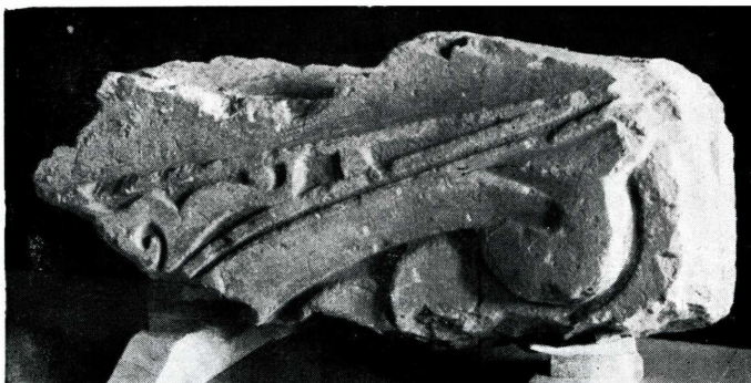
b) Fragmento de gárgola de mármol blanco, esculpura. Siglo XIII. Museo de la Alhambra.