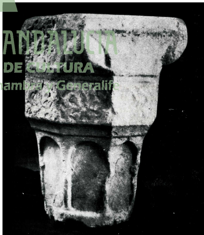
b) Capitel de mármol, del siglo XIII. Museo de la Alhambra.

JUNTA DE ANDALUCÍA CONSEJERÍA DE CULTURA Patronato de la Alhambra y Generalife