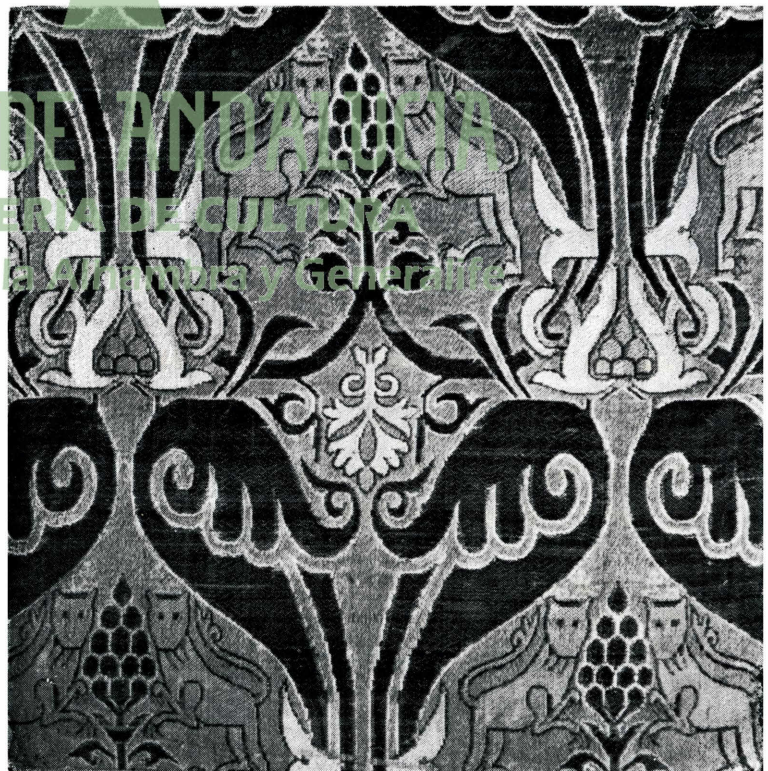
b) Fragmento de tejido de seda morisco, con leones y granadas. Museo de la Alhambra.

JUNTA DE ANDALUCÍA CONSEJERÍA DE CULTURA Patronato de la Alhambra y Generalife