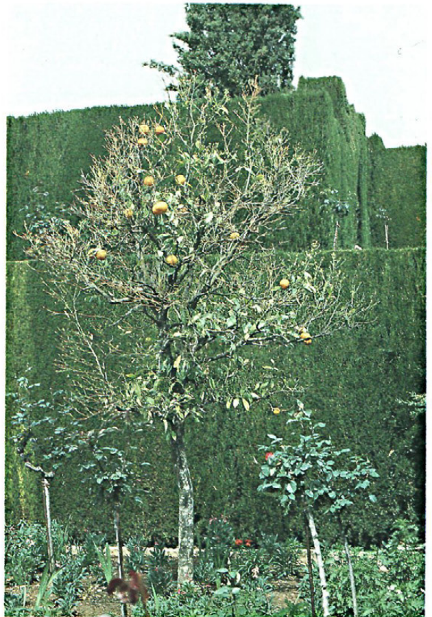
Fig. 1.—Naranjos atacados por Tylenchulus semipenetrans (Alhambra y Generalife)