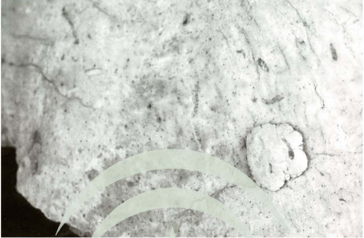
Lám. 6. Osteoma osteoide en el frontal de un varón adulto.

JUNTA DE ANDALUCIA CONSEJERÍA DE CULTURA Patronato de la Alhambra y Generalife