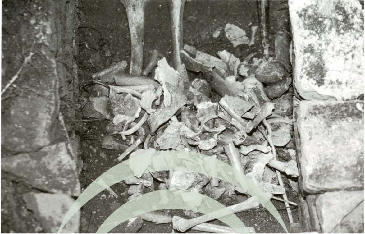
Lám. 2. Conjunto de huesos, de varios individuos, situado a los pies del esqueleto completo.

JUNTA DE ANDALUCIA CONSEJERÍA DE CULTURA Patronato de la Alhambra y Generalife