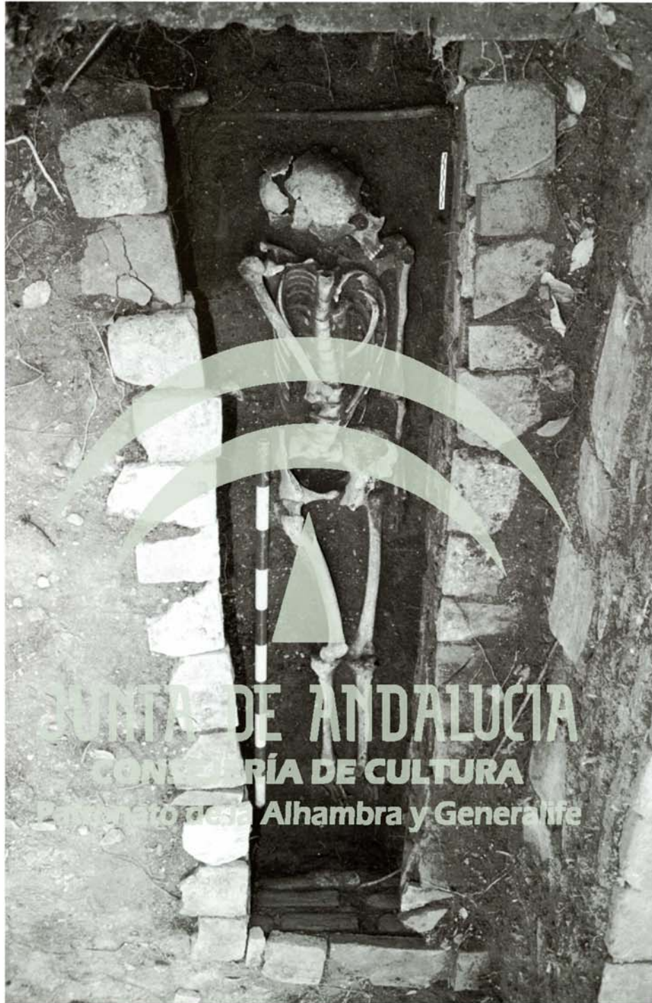
Lám. 3. Una vez limpia y estudiada la sepultura, tal como quedó para ser cubierta de nuevo.