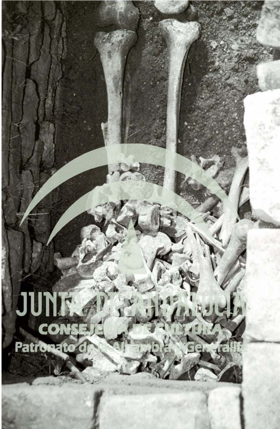
Lám. 4. El conjunto de huesos de otros sujetos también se volvió a dejar in situ.