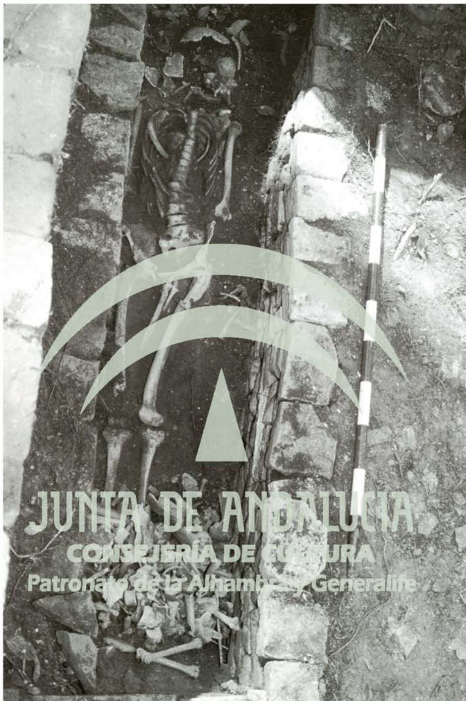
Lám. 1. Vista general de la sepultura, antes de la limpieza.