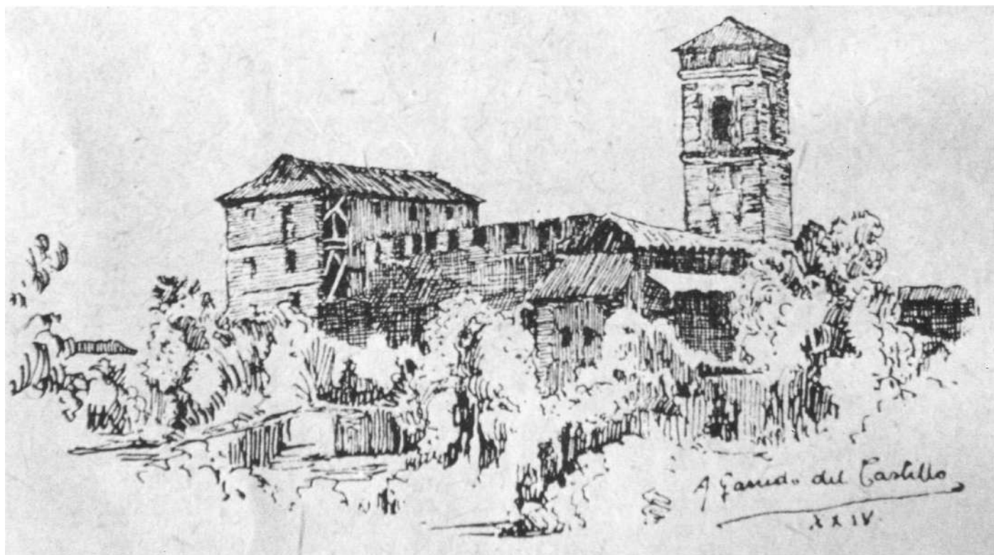
Convento de San Francisco de la Alhambra en ruinas, dibujo de Garrido del Castillo, en la obra Granada gráfica, publicado en julio de 1924, Archivo y Museo Casa de los Tiros, Consejería de Cultura de la Junta de Andalucía, Granada.

La Iglesia con sus capillas, para la colocación de las piezas con su material, el armamento por recomponer, balerío de fusil y otros varios efectos. El claustro bajo con el patio del Edificio, para la remoción de efectos, empaque de los que se remiten a otros puntos, desempaque de los que se reciben de otras plazas; y reconocimiento del armamento y municiones que devuelvan los Cuerpos de la guarnición. El claustro alto, para los reconocimientos del armamento corriente que se entrega a los Cuerpos del Ejército, y también las seis habitaciones que en dicho local se hallan, las cuales por sus números indico a continuación el objeto para el que se destinan. n.º 1. Está dedicado para la elaboración de la Cartuchería de fusil desde que el Cuerpo estableció el parque en el indicado Convento, y por efecto de lo ruinoso que se hallaba esta habitación, fue preciso abandonarla; pero habiendo sido reparada, debe servir otra vez para el efecto para que fue desti-