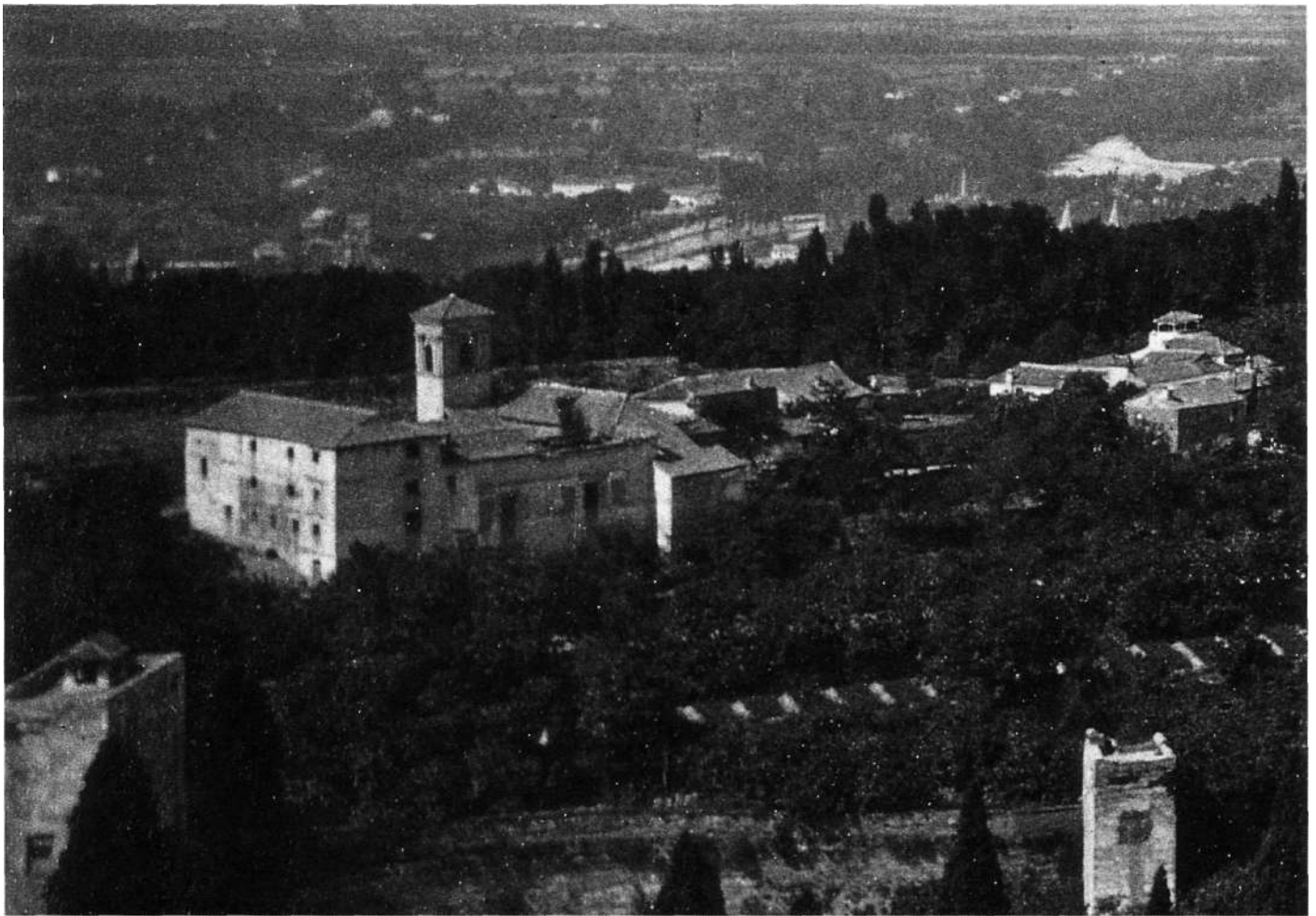
Convento de San Francisco de la Alhambra, Granada, detalle de Laurent, hacia 1870, Biblioteca Nacional, Sign. 17-2 bis n° 98, Madrid.

que los militares pusieran de nuevo la mirada en el cenobio e hicieran esta interesante valoración del inmueble: