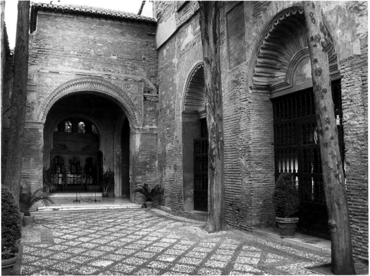
La nave de la iglesia sin techar, las capillas laterales abiertas al claustro y el mirador nazarí, Parador de Turismo San Francisco de Granada, Fotografía: J.M. Barrios Rozúa.

sería lamentable que se continuara hoy vendiendo lo que tal vez pasado algún tiempo vendría a ser alguna joya preciosa que en manos privadas quedaría perdida, así ha sucedido con la Torre de las Damas, la Puerta del Bino y otras que podría citar 56 .