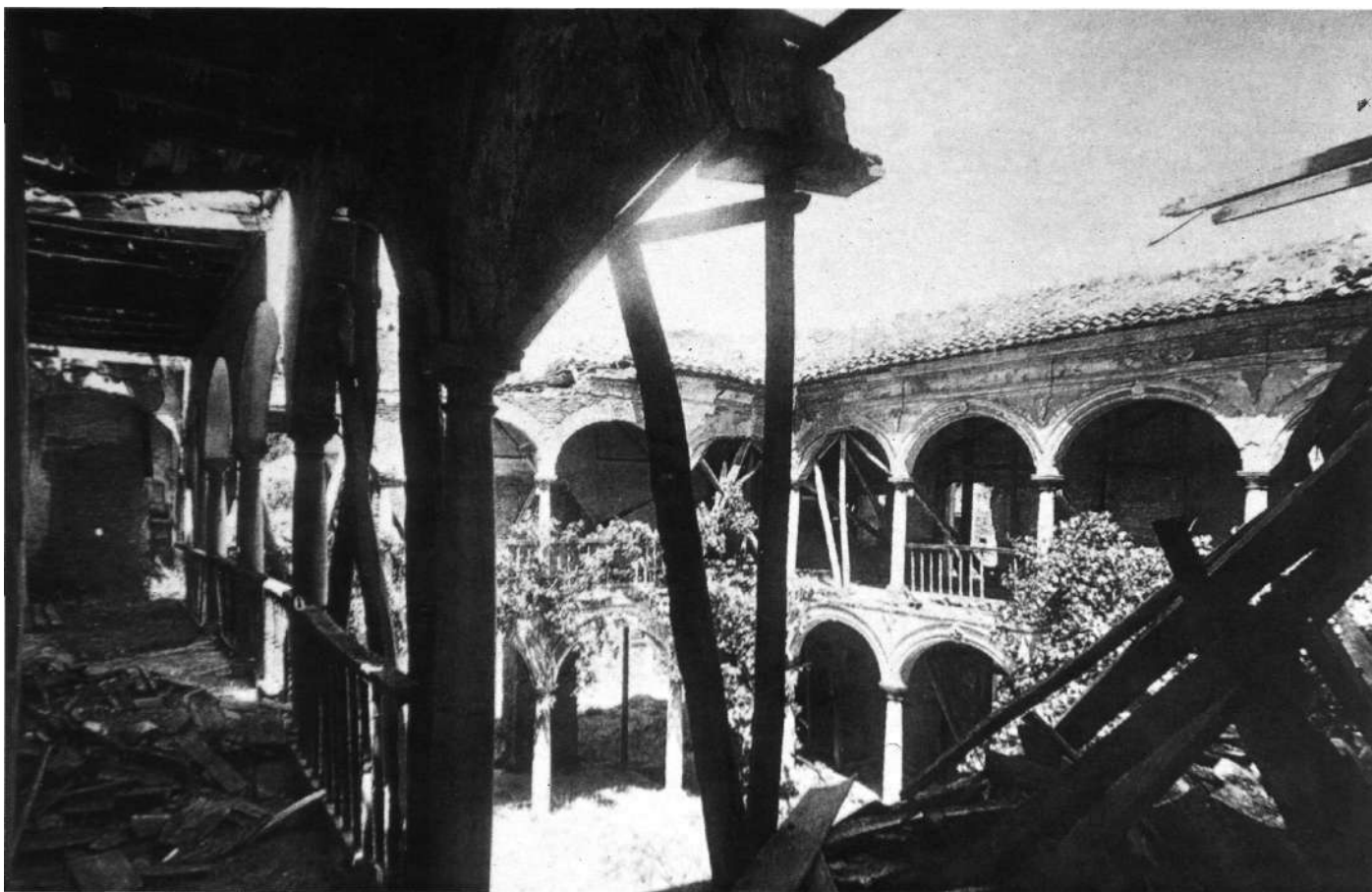
El Patio del Convento de San Francisco de la Alhambra con las galerías hundidas, fotografía de Torres Molina, 1924, Archivo y Museo Casa de los Tiros, Consejería de Cultura de la Junta de Andalucía, Granada.

...desde que se ha comprendido el interés histórico y monumental de la Alhambra se ha deplorado el que el Real Patrimonio haya hecho enagenacion de una multitud de edificios y terrenos que mas o menos constitúan la masa de edificios árabes de este simpar recinto, que