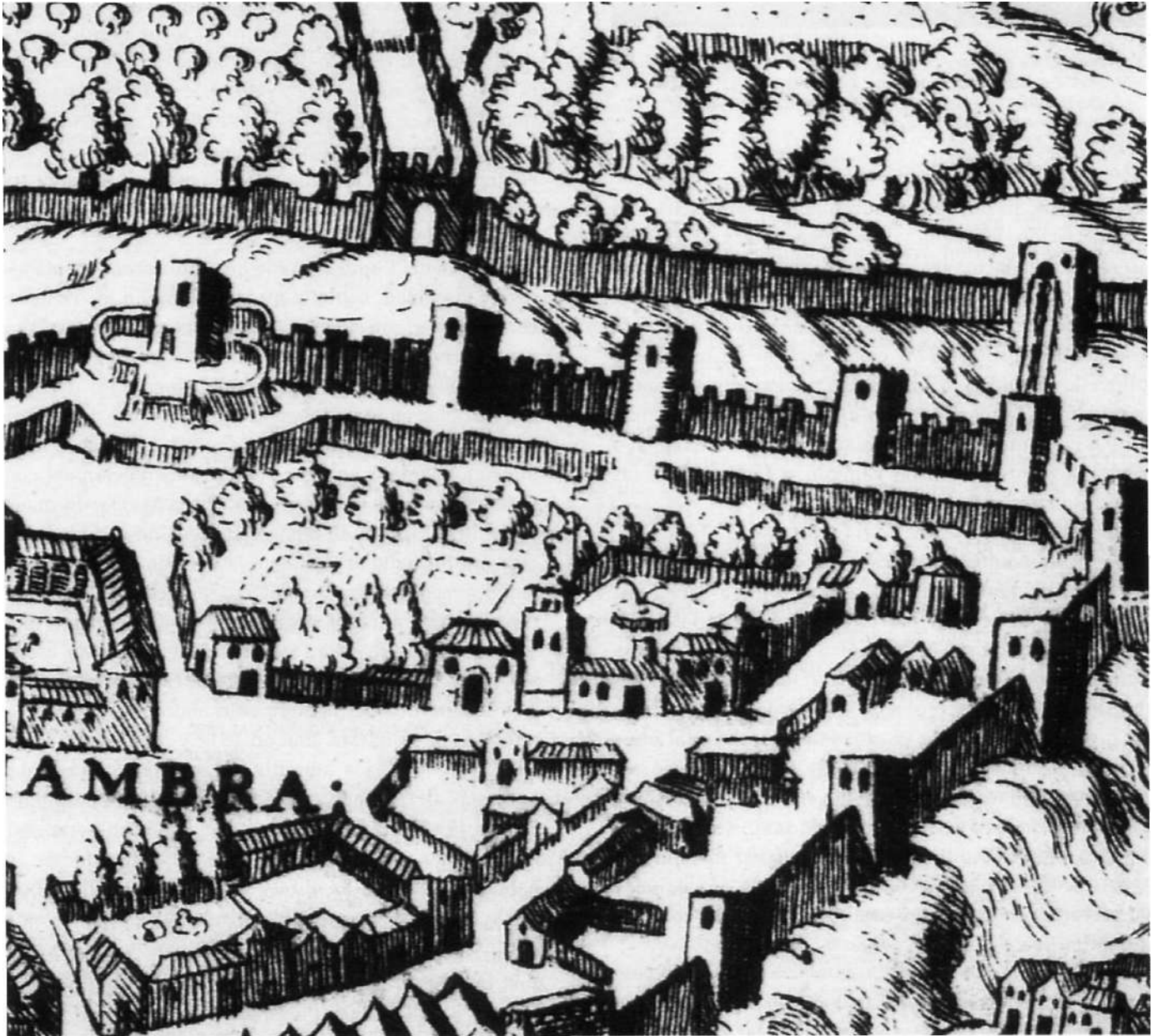
Plataforma de Granada, Ambrosio de Vico, Plano del Convento de San Francisco de la Alhambra, 1611, detalle del grabado de Francisco Heylán, Sign. APAG, Colección planos, 4220, Archivo del Patronato de la Alhambra y Generalife, Granada.