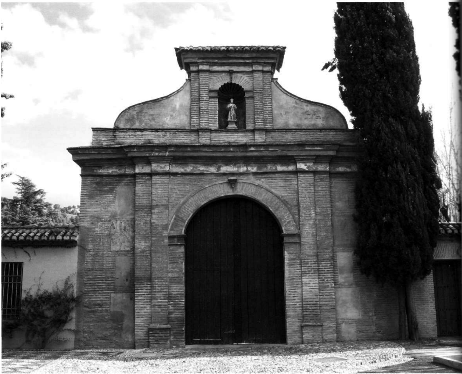
Portada de acceso al compás, Parador de Turismo San Francisco de Granada , Fotografía: J.M. Barrios Flozúa.

El núcleo de la residencia conventual, conservada perfectamente gracias a la restauración de Torres Balbás, cuenta con un claustro de dos pisos, el inferior con columnas de piedra de Elvira de acentuado éntasis, y el superior con fustes más gráciles; las claves de los arcos se adornan con follajes y las enjutas con paneles recortados en la línea de la ornamentación inventada por Alonso Cano, aunque el patio puede fecharse en la primera mitad del siglo XVIII. Las galerías se cubren con sencillas armaduras de madera reforzadas en las esquinas con arcos fajones; la galería superior tuvo una serie de cuadros enmarcados en escayola que narraban la vida de San Antonio. Las celdas y salas del Convento eran de una gran austeridad, como delatan los inventarios de tiempos de la desamortización, así como la escalera, hoy reconstruida. Adosadas a la fachada del Convento hubo otras dependencias de las que no conservamos descripciones y que al ser derribadas dejaron unas feas medianeras que obligaron a Torres Balbás a hacer la