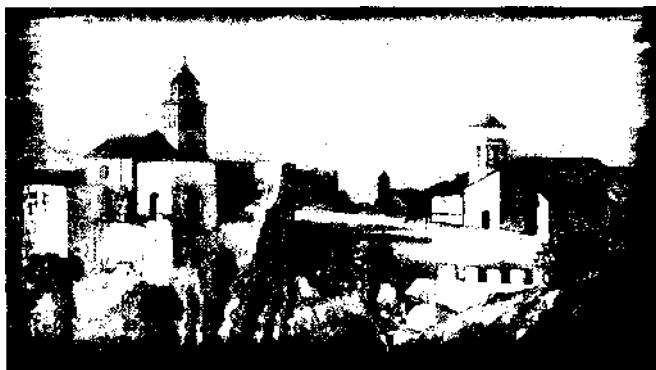
Alhambra, detalle del grabado de W. Westall. A.R.A. dibujado por I.H.S. Bucknall Estcourt y publicado por J. Dickenson, 1832, Biblioteca del Patronato de la Alhambra y Generalife, Sign. A-52 07.

Del palacio nazarí sólo quedaba, al producirse la exclaustración, lo que hoy conocemos, o sea, el antiguo mirador del palacio, algunos restos de las dependencias del lado oriental, la acequia y el estanque, mientras que la parte occidental aparece ya en el mapa topográfico de José de Hermosilla (1770) como terreno de huerta 3 y sobre ella se edificó la ampliación del Parador Nacional. En cuanto al baño, situado en una cota inferior al mirador y a Poniente de éste, su desaparición parece también temprana y sus ruinas no salieron a la luz hasta las excavaciones de 1946.