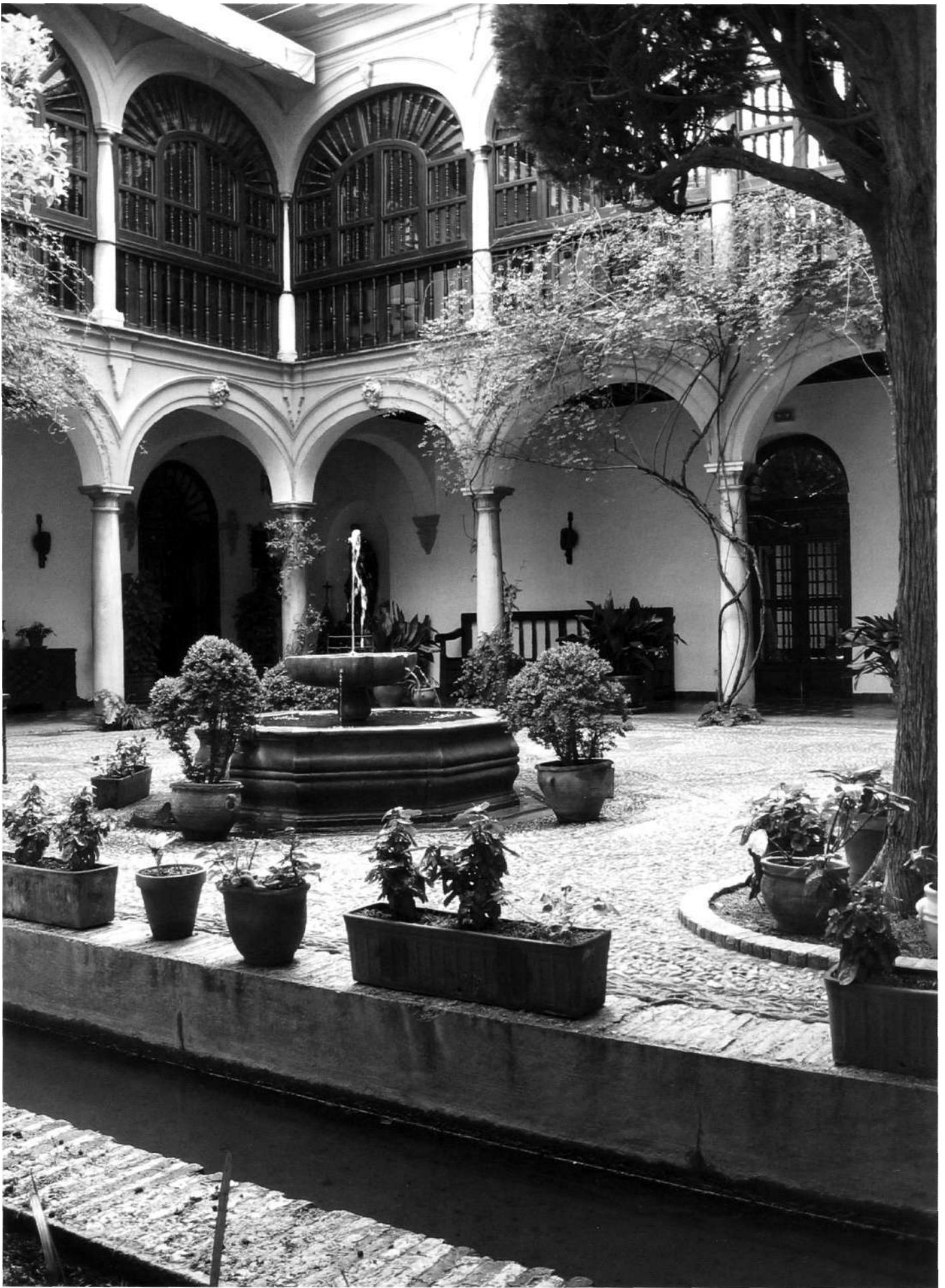
El claustro del Convento atravesado por la acequia real, con la Fuente que se colocó tras la restauración de Torres Balbás, Parador de Turismo San Francisco de Granada, Fotografía: J.M. Barrios Rozúa.