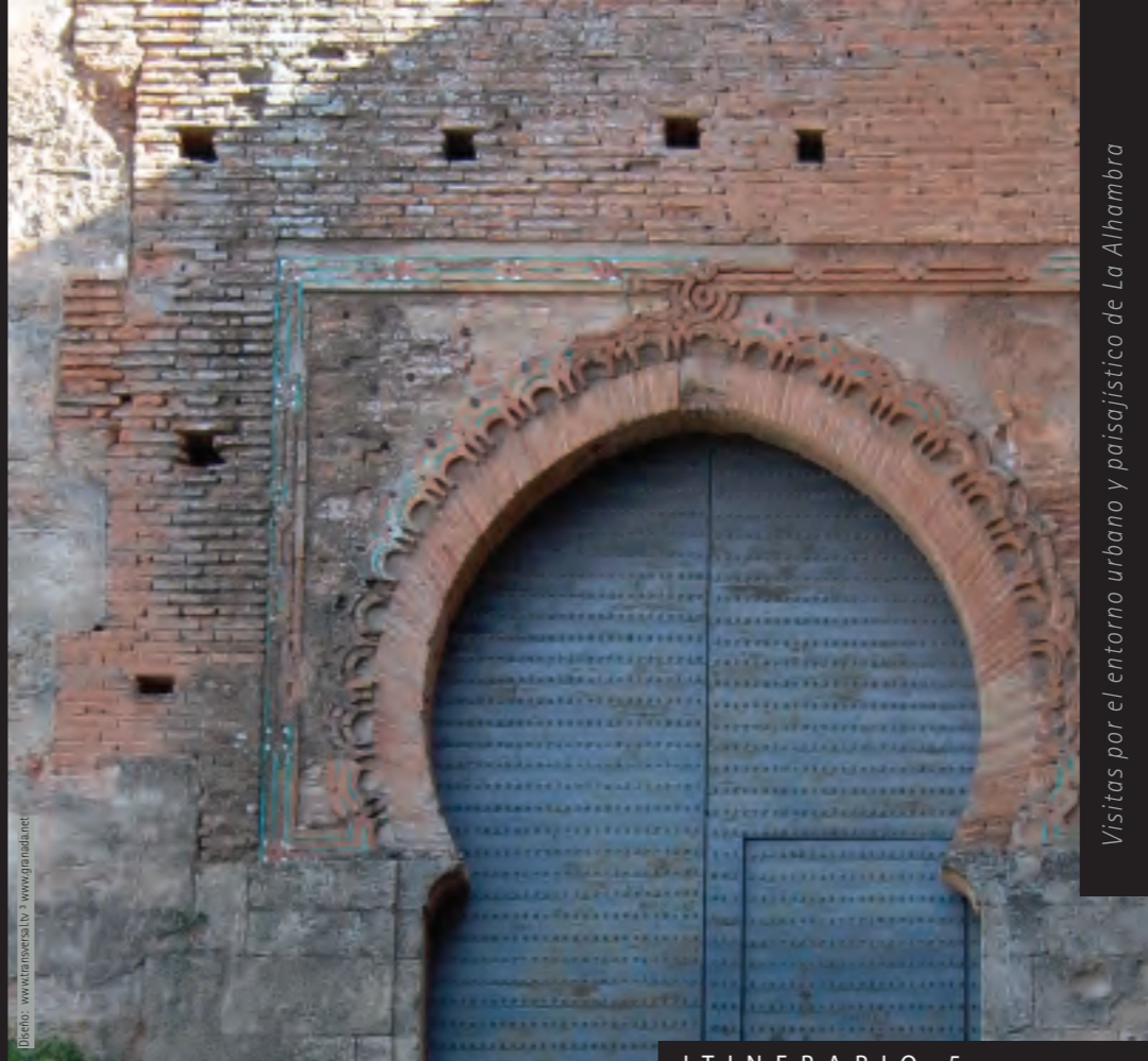
Visitas por el entorno urbano y paisajístico de La Alhambra