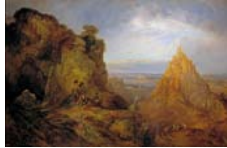
Genaro Pérez Villaamil (1807–1854) Vista del Castillo de Gaucín 1849 Óleo sobre lienzo / Oil on canvas, 124 x 147 cm Madrid, Museo Nacional del Prado, inv. n.º P-6574