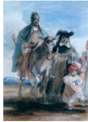
David Wilkie (1785–1841) Spanish Travellers 1827 Acuarela / Watercolour, 29,8 x 20,8 cm Aberdeen, Escocia, Aberdeen Art Gallery & Museums, inv. n.º ABDAG003523