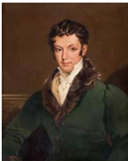
Gilbert Stuart Newton (1794-1835) Retrato de Washington Irving Portrait of Washington Irving 1820 Óleo sobre lienzo / Oil on canvas, 79,5 x 95,2 cm Patronato de la Alhambra y el Generalife, Colección Fondos Artísticos Patronato de la Alhambra y el Generalife, Art Collection, inv. n.º R-172